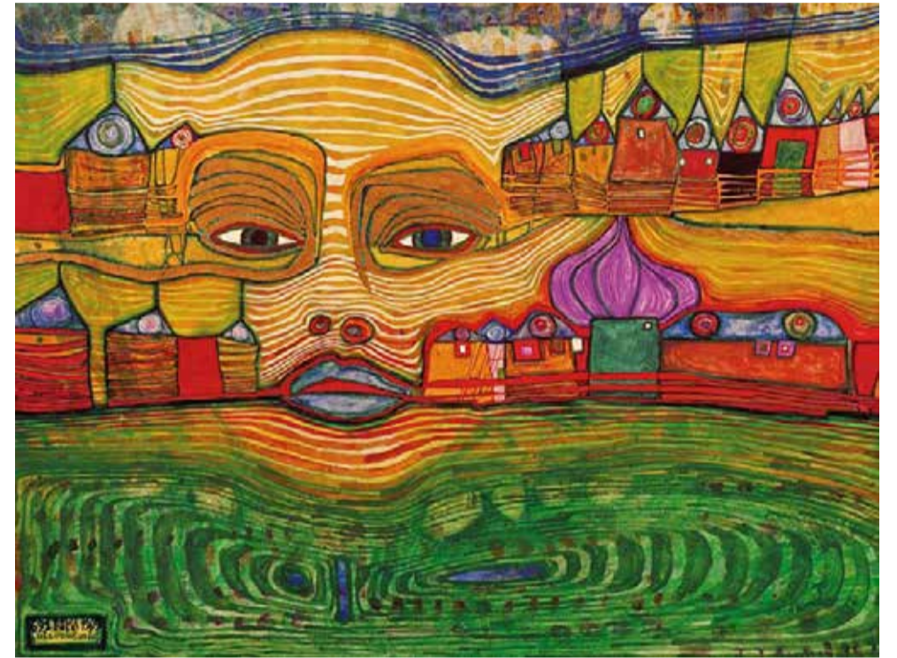
Friedensreich Hundertwasser - 738 Grass for those who cry (1975) © Namida AG

V ous allez être dans la confiance : l'histoire de la MLOA commence il y a plus de trente ans !